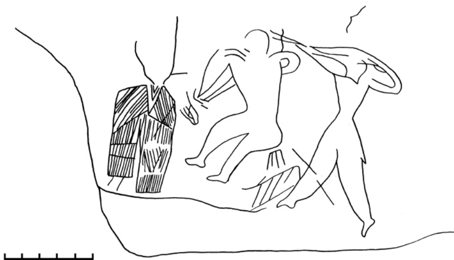
Рис. 1. Плоскость с антропоморфными персонажами. Юго-восточная оконечность южной вершины горы Тепсей [13, рис. VII] Fig. 1. Anthropomorphic images. South-eastern tip of the southern peak of Tepsey [13, fig. VII]

и на скалах. У многих персонажей прослеживаются некоторые знаковые детали, маркирующие изображения таштыкского времени: например, заостренным уголком намечены полы приталенных кафтанов (рис. 1, 2), различается лишь их длина, которая могла быть как до середины бедра, так и до колен. Такой прием передачи кафтана таштыкцев зафиксирован не только на Тепсее, но и на многих памятниках Минусинской котловины [6, рис. 13, 28; 11, табл. 6; 14, рис. 1; 15, рис. 4; 16, рис. 8] и, очевидно, может считаться датирующим.