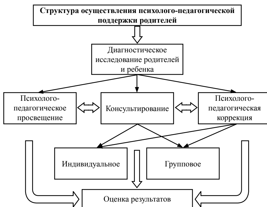
Рис. 1. Структура осуществления психолого-педагогической поддержки родителей Fig. 1. Structure of psychological and pedagogical support of parents

ально-психологический. Именно качественная характеристика их наполнения выступает платформой для выстраивания задачи и выделения критериев сформированности родительской компетентности.