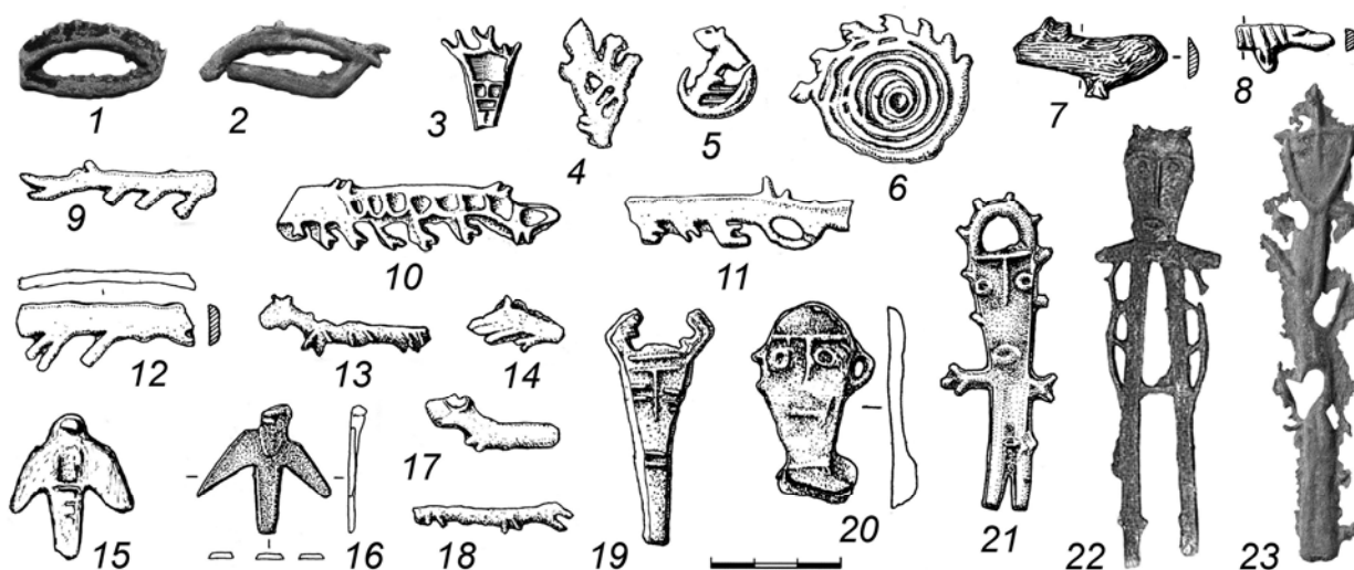
Рис. 1. Металлопластика эпохи бронзы и начала железного века из Сургутского Приобья: 1 – 2 – сел. Мохтикъяган 8; 3, 7 – гор. Барсов городок I/3; 4 – 6, 10 – 11, 15, 17 – сел. Барсова гора III/49 (объект 161); 8 – гор. Барсов городок III/1; 9, 20 – 21 – сел. Барсова гора IV/10; 12 – сел. Барсова гора III/22; 13, 18 – сел. Барсова гора I/21; 14 – пос. Барсова гора III, объект 240; 16 – сел. Барсова гора III/72; 19 – сел. Барсова гора III/19; 22 – гор. Стрелка; 23 – сел. Мохтикъяган 4 (1 – 2, 23 – по Е. В. Переваловой, К. Г. Карачарову; 22 – по О. В. Кардашу, Т. М. Пономаревой)

ямочной керамики». Именно генезисом кулайских культур, в первую очередь, а не миграциями, может объясняться та гигантская территория, на которой изначально формируется кулайская КИО.