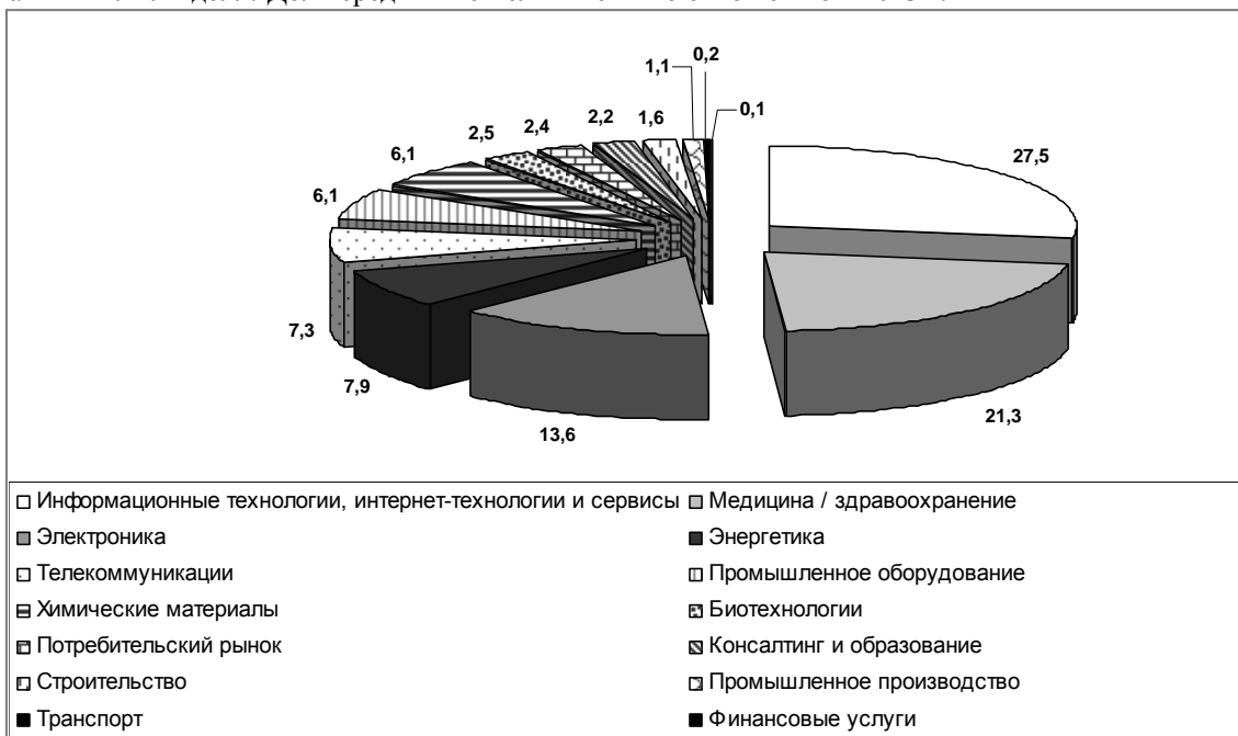
Рис. 2. Распределение инвестиций по секторам экономики за 2007 – 2015 гг. [8]

и крупных сделок в общей их структуре существенно сократилась. Почти наполовину снизилась в 2014 г. цена на нефть [5]. ЦБ РФ в связи с актуальными изменениями в экономической ситуации страны вынужден был пересмотреть сценарий на 2015 г., прогнозируя падение экономики в размере до 5 % [12]. Структура сделок на российском рынке существенно не изменилась: лидирующее положение занимает топливно-энергетический комплекс, однако количество сделок в данном сегменте снизилось в 2014 г. на 77 % по отношению к 2013 г.